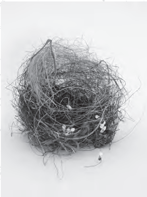
Björn Braun / Meyer Riegger, Berlin / Karlsruhe