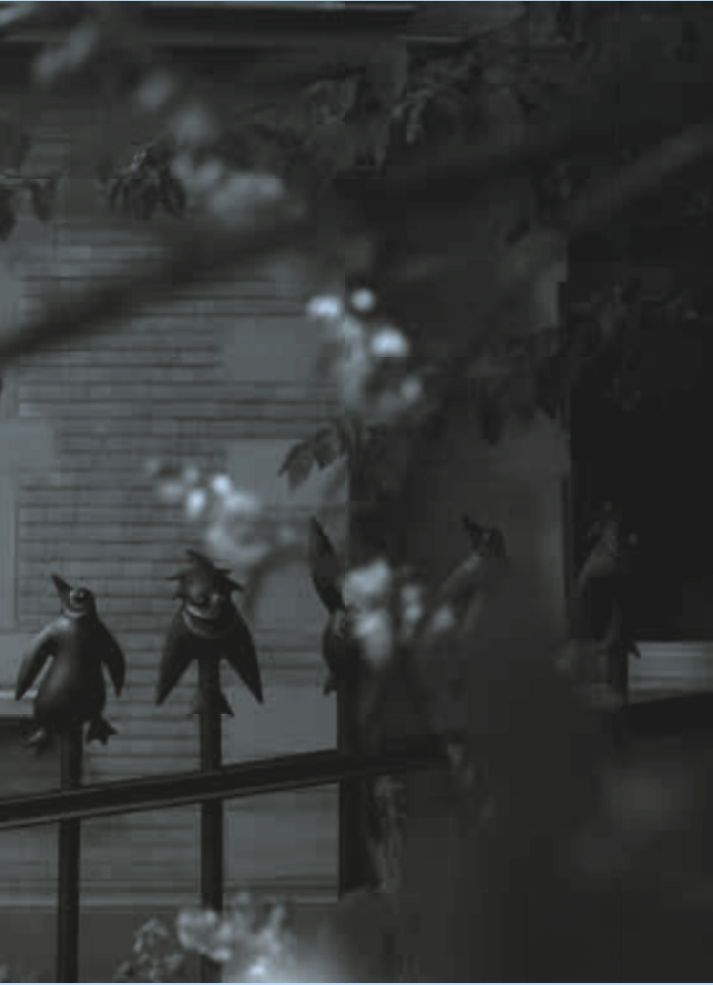
Gusseisenzaun R. Bunnit, Peter Pin & Didoo #13, aus der Serie Sweet Dreams Security* Permanente Installation im öffentlichen Raum, 70184 Stuttgart * Foto: © Felix Amsel

Die Architekturgalerie am Weißenhof Stuttgart wird unterstützt von: Architektenkammer Baden-Württemberg, Beton Marketing Süd, BDA Bund Deutscher Architekten Baden-Württemberg, optiplan GmbH daten & druck, Eicher Werkstätten, JUNG, Gisela und Wolfgang Kaiser, Landes-hauptstadt Stuttgart, Malerwerkstätten Heinrich Schmid und TTR Technologiepark Tübingen-Reutlingen. Darüber hinaus helfen uns Sponsoren und Stiftungen mit einmaligen Zahlungen Aus-stellungsvorhaben zu realisieren. Die Architekturgalerie am Weißenhof Stuttgart ist Koopera-tionspartner von: Weissenhofmuseum im Haus Le Corbusier/ Freunde der Weissenhofsiedlung e.V. und Weissenhofwerkstatt im Haus Mies van der Rohe/ Freunde der Weissenhofsiedlung e.V.