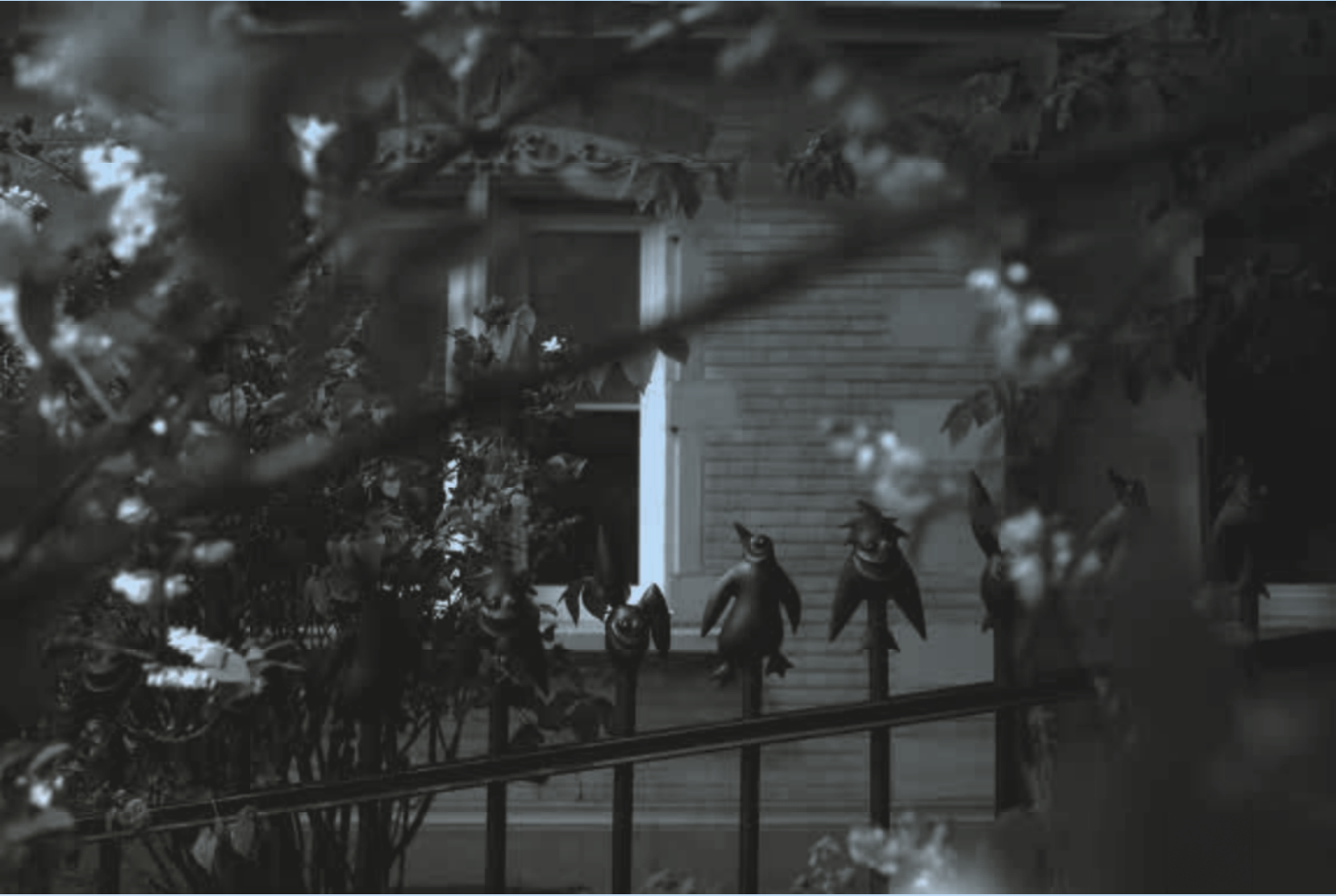
Gusseisenzaun R. Bunnit, Peter Pin & Didoo #13, aus der Serie Sweet Dreams Security* Permanente Installation im öffentlichen Raum, 70184 Stuttgart * Foto: © Felix Amsel