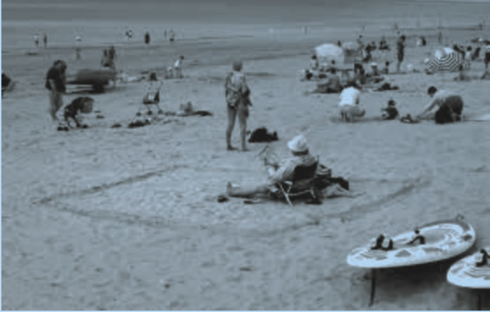
Dokumentation Strand Visuelle Forschung, Living Archive, Cannes, 2008 * Foto © Matthias Megyeri