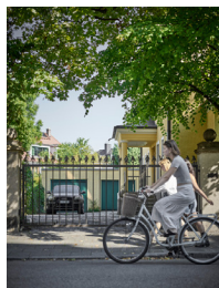
AGW_SDS_7_@MMegyeri /// AGW_SDS_8_@MMegyeri

Gußeisenzaun R. Bunnit, Peter Pin & Didoo #12, aus der Serie Sweet Dreams Security®; Permanente Installation im öffentlichen Raum, 80803 München —