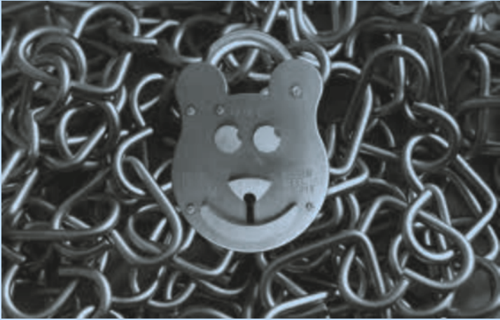
Vorhangschloss Billy B. by HY Squire & Sons Ltd., Edelstahlkette Love Chain - A Made in Germany by Sweet Dreams Security®, 2018 * Foto © Matthias Megyeri

Architektur galerie am Weißenhof Stuttgart